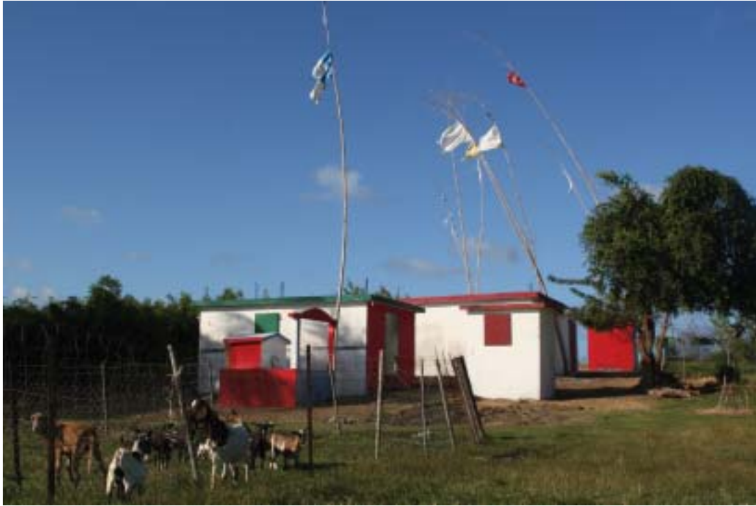
Ensemble de temples, commune de Saint-François.

Après sa mort, un culte lui fut rendu et depuis le XVI e siècle il est l'objet d'un important pèlerinage annuel.