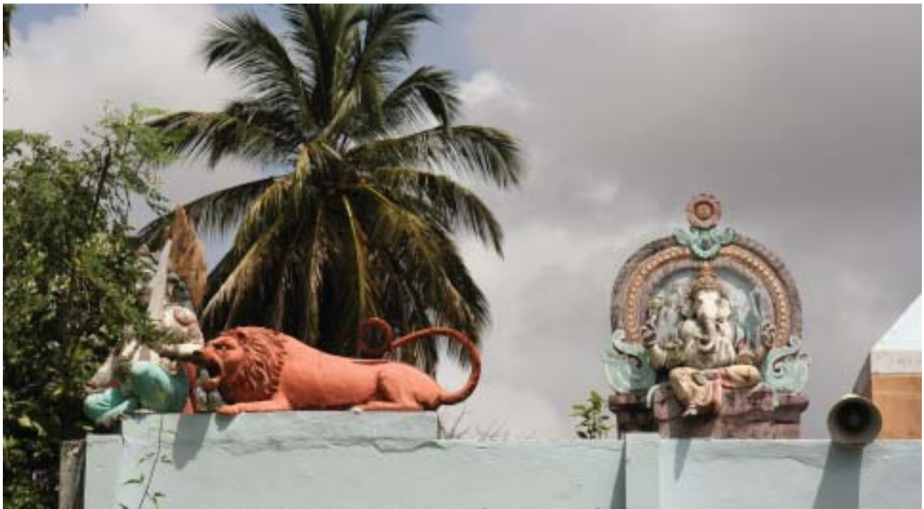
Le temple de Chany, à Capesterre Belle Eau est le plus important de Guadeloupe.

Multiraciale, la Guadeloupe est une île où les religions aussi diverses que le christianisme, l'hindouisme voire l'animisme, cohabitent en parfaite harmonie. Plus de 400 temples existent sur l'île dans lesquels sont pratiqués régulièrement les cultes provenant des Indes.