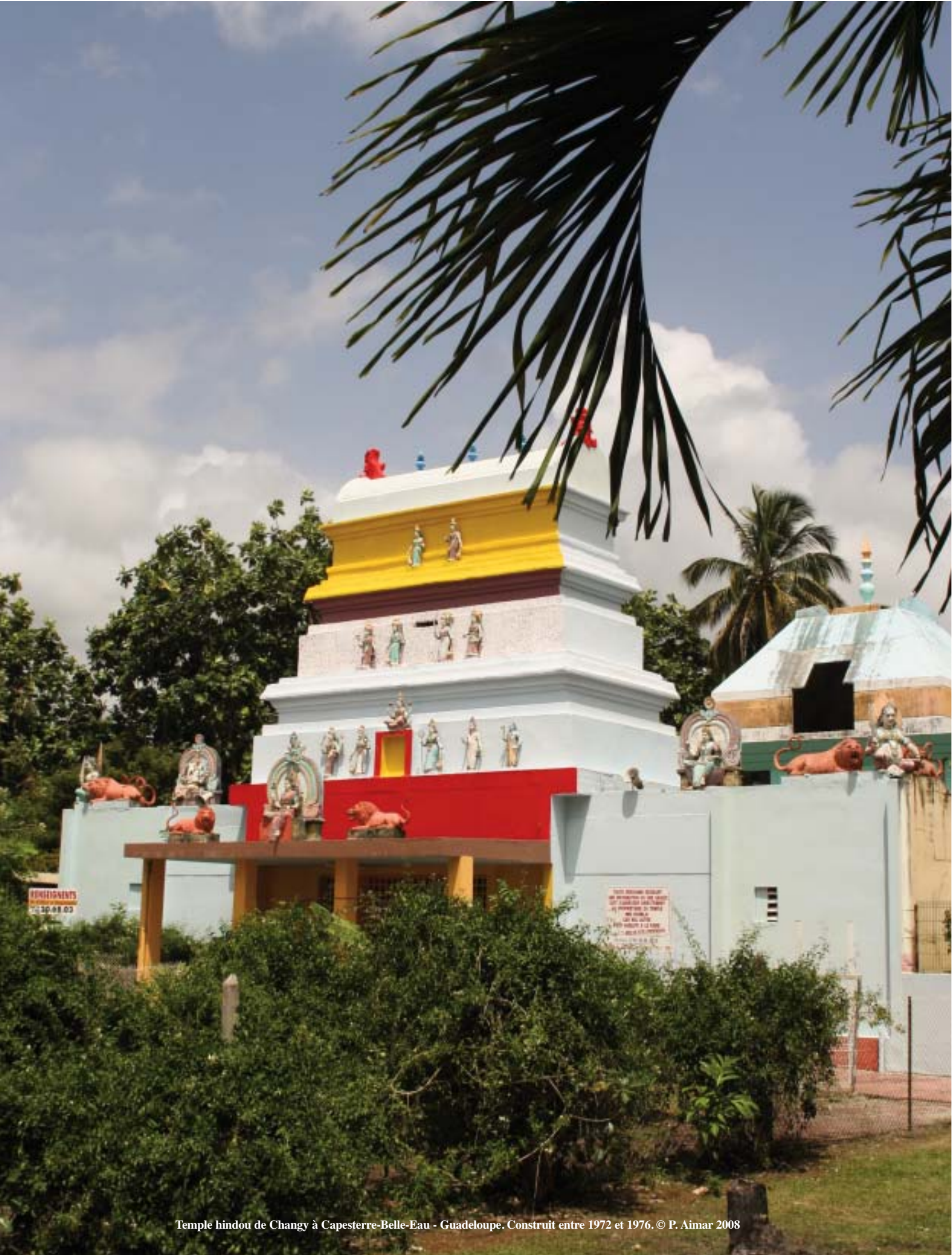
Temple hindou de Changy à Capesterre-Belle-Eau - Guadeloupe. Construit entre 1972 et 1976.