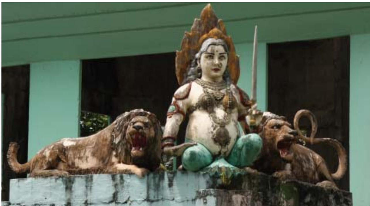
Temple de Changy. Divinité hindou protégée par les lions.

était sûr d'avoir touché lorsqu'il longera plus tard Cuba. Il mourra avec la conviction profonde d'avoir vraiment atteint le Japon.