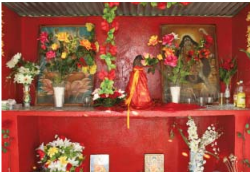
Autel de temple privé situé en plein champ à Zévalos.

Ces travailleurs volontaires sont plus que mal vus par les esclaves libérés. A l'issue de leur contrat de cinq ans, les planteurs et le gouvernement du Second Empire failliront à leur engagement : jamais les coolies ne toucheront leur billet de retour au pays.