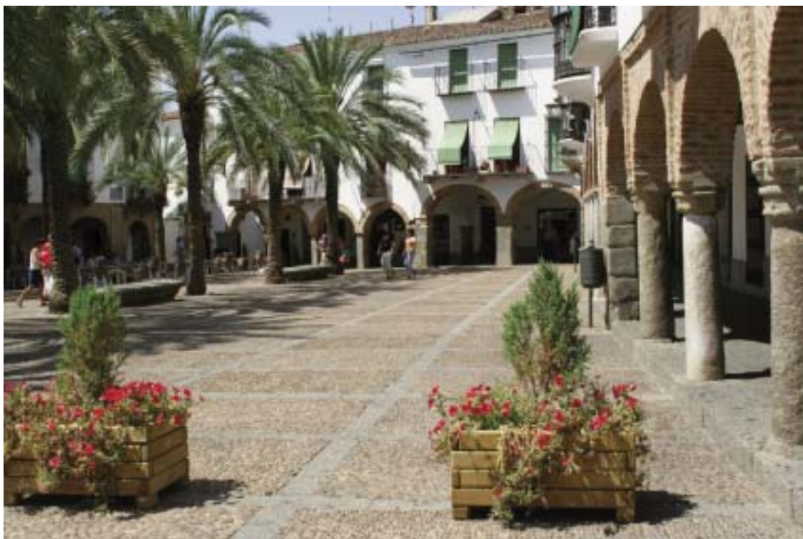
La plaza Grande permet d'accéder à la plaza Cica

murs blancs et briques, fleurissements dans des pots bleus Séville, on trouve en ces lieux toute l'atmosphère andalouse assortie à la lumière qui donne de superbes images de vacances.