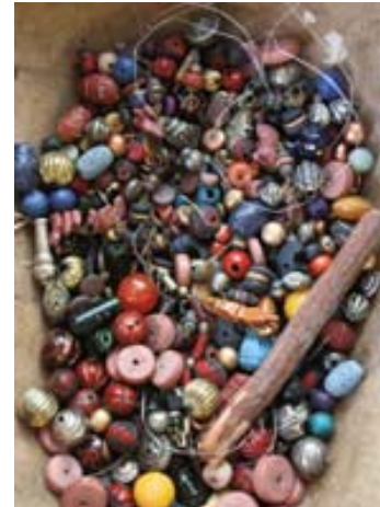
Des perles ramassées au gré des pas deviendront peut-être chef d'œuvre.

Le plus surprenant à la découverte des sculptures d'Alex Boucaud c'est l'authenticité de ses œuvres. Expliquons le qualificatif « authentique ». La plupart des sculptures de l'artiste guadeloupéen ont une parenté forte avec les masques et totems d'Afrique Noire que nous avons l'habitude de voir chez Barbier-Mueller à Genève ou dans certaines sections au musée du Quai Branly.