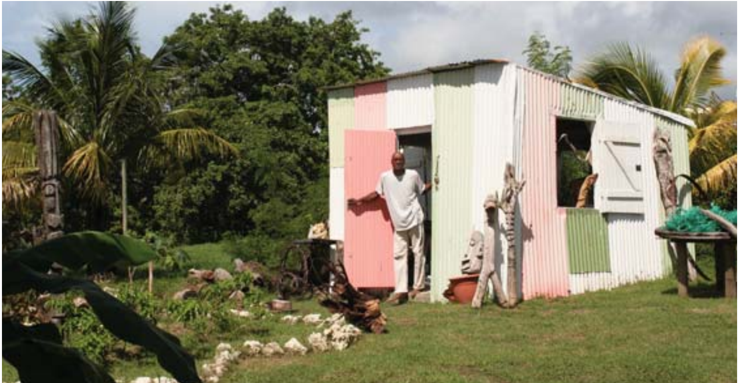
L'atelier de tôles est planté dans la campagne de Sainte-Anne. Espace et confort minimum, c'est l'imagination qui est sans frontières.