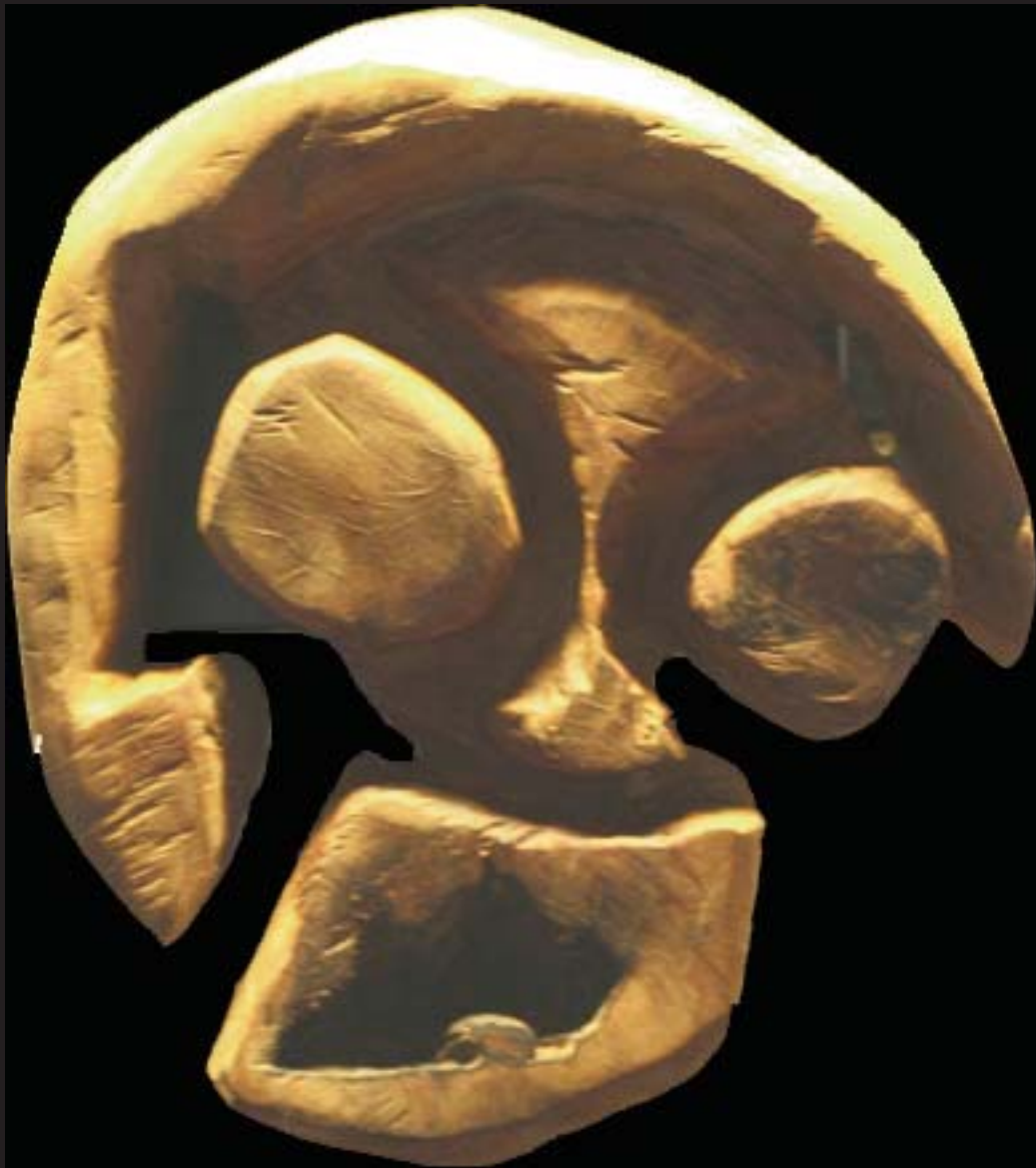
Alex Boucaud, Masque , bois. 2008. C'est le bois qui a imposé cette figure grimaçante et souffreteuses.