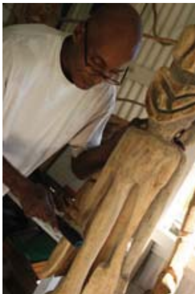
Polissage d'un totem.