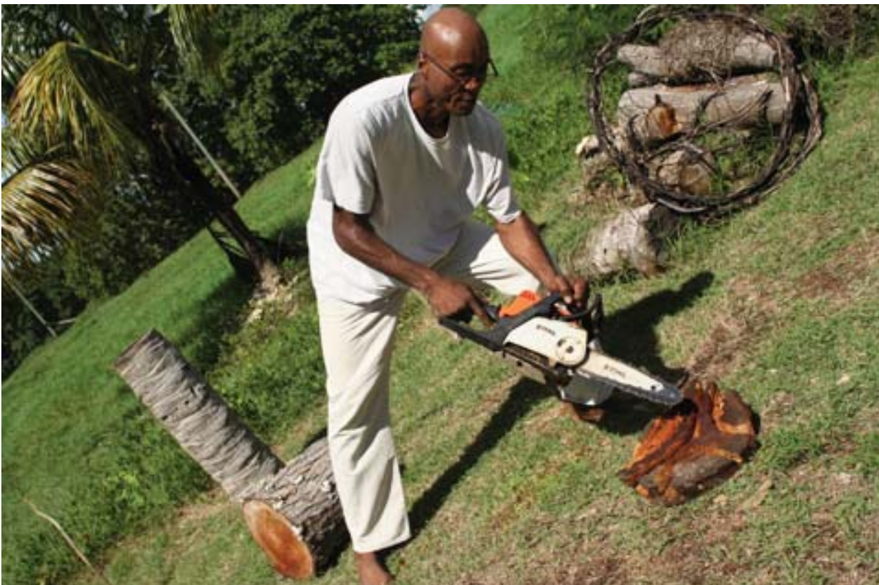
La première ébauche nécessite la tronçonneuse dans des conditions précaires.