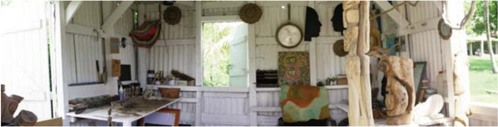
Bois et tôles, peinture blanche, l'atelier est fonctionnel. Chaque chose à sa place et les œuvres en cours prennent patience.

Le plus surprenant à la découverte des sculptures d'Alex Boucaud c'est l'authenticité de ses œuvres. Expliquons le qualificatif « authentique ». La plupart des sculptures de l'artiste guadeloupéen ont une parenté forte avec les masques et totems d'Afrique Noire que nous avons l'habitude de voir chez Barbier-Mueller à Genève ou dans certaines sections au musée du Quai Branly.