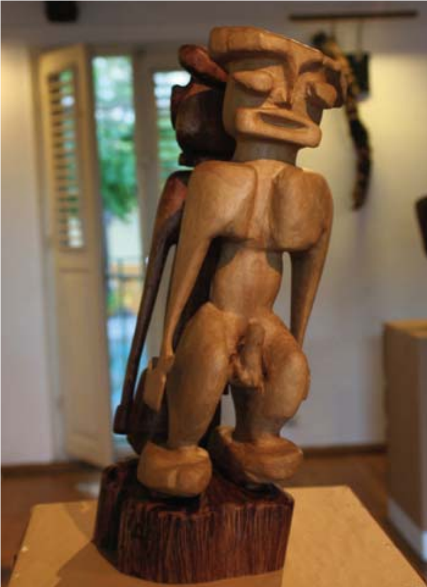
Alex Boucaud, Totem bi-face , bois. 2008. © P. Aimar 2008

Ci-contre. Alex présente les outils à bois offerts par un vieil ébéniste. © P. Aimar 2008