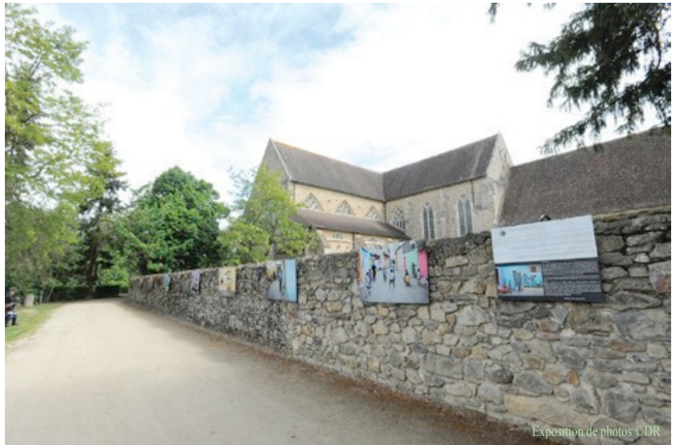
Exposition de photos CDR

Pour la troisième année, c'est une photographie de l'artiste danois Nikolaj Lund qui a été retenue pour le visuel du festival. Il est lui-même violoncelliste et, par sa connaissance de la musique classique, il est à même de demander à ses modèles musiciens d'adopter des pauses décalées. Nous vous invitons à découvrir son travail sur les grilles de l'Hôtel du Département – Préfecture jusqu'au 1 er juin 2018.