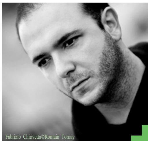
Fabrizio Chiovetta