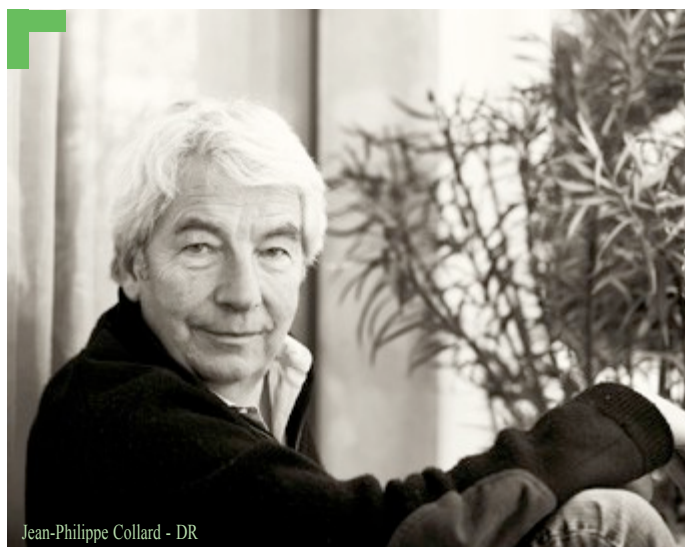
Jean-Philippe Collard

Interprète recherché dans le monde entier, Jean-Philippe Collard est aujourd'hui fort d'une discographie de plus de cinquante titres, et se produit sur les plus grandes scènes internationales : de Carnegie Hall au Teatro Colon en passant par le Théâtre des Champs-Élysées et le Royal Albert Hall. Il joue avec les chefs et orchestres les plus prestigieux du monde.