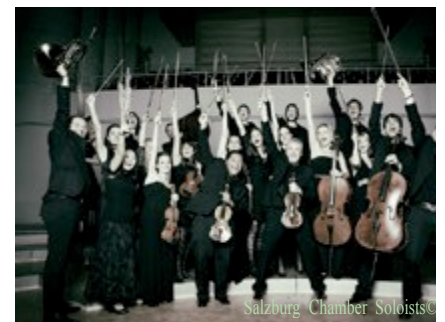
Salzburg Chamber Soloists ©