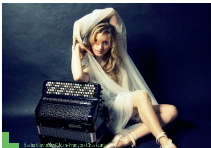
Basha Slavinska

Mi polonaise mi hongroise, Basha Slavinska est l'une des plus brillantes et étonnantes accordéoniste virtuose d'aujourd'hui. Ses capacités uniques lui permettent de s'ouvrir avec une extrême facilité à toutes les formes, styles et époque de musique.