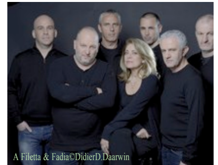
A Filetta & Fadia