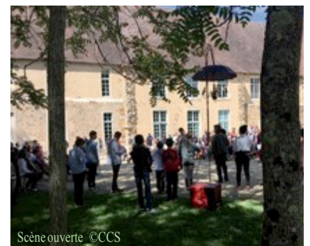
Scène ouverte

L'orchestre est composé d'une cinquantaine de musiciens, tous bénévoles, qu'ils soient amateurs de haut niveau exerçant une activité professionnelle sans rapport avec la musique, en formation professionnelle au métier de musicien/enseignant, étudiants ou encore musiciens professionnels. Ce mélange de différents profils est