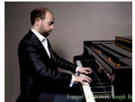
François DUMONT