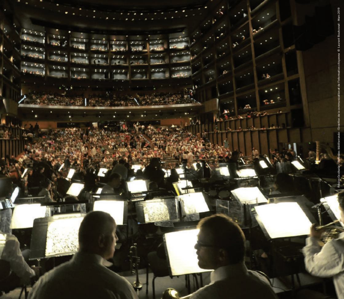
Région Occitanie / Photo: Méditerranée - Direction de la communication et de l'information citoyenne © Laurent Bouteaud - Mars 2019