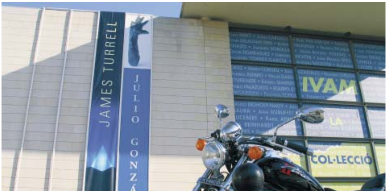
L'IVAM, musée d'art contemporain

Ces 160 hectares n'ont pas été la proie des bétonneurs mais dévolus à des urbanistes qui ont aménagé des parcs, des bassins, des fontaines, des promenades qui longent le Palau Musical, mènent au nouvel opéra, à la cité des sciences et des arts, au musée