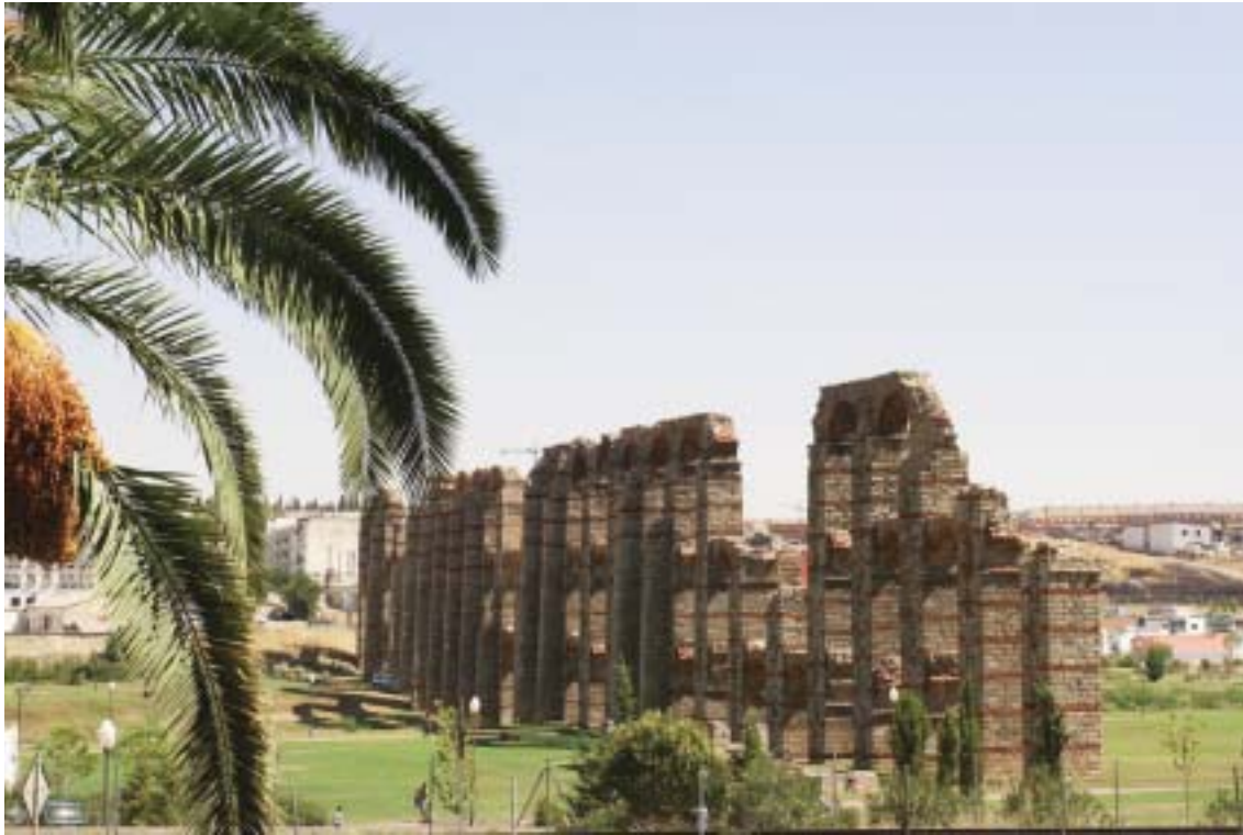
Vestiges de l'aqueduc romain qui acheminait l'eau à Emerita Augusta depuis le réservoir de Proserpine, situé à 5 km de la ville

basilique Visigothe et 800 ans plus tard, une mosquée, ce qui explique les gravures sur les colonnes. Cela devient au Moyen Age pour la chrétienté, la paroisse Saint-Jacques, puis le Couvent de Jésus et au XVIIIe siècle, un hôpital de l'ordre de Santa