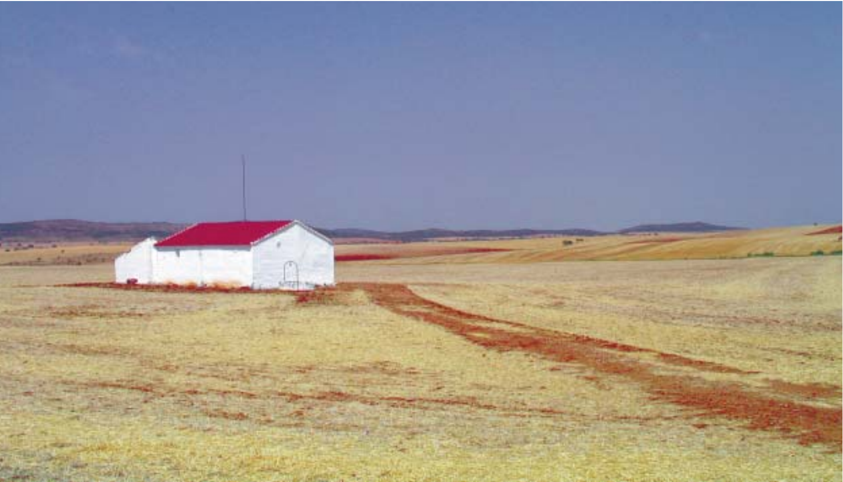
Andalousie. De “gueules, d’or et d’azur”, les vraies couleurs du blason andalou

Tout accaparé par l’enchantement de l’art grenadin et de ses palais, ou le bel ordonnancement de Séville au bord du Guadalquivir - bel alignement des avenues bordées d’arbres immenses ou places aux orangers-, le visiteur échappe d’abord à l’Andalousie pro-