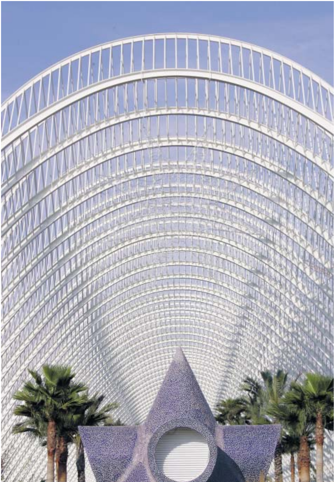
Promenade du nouveau jardin