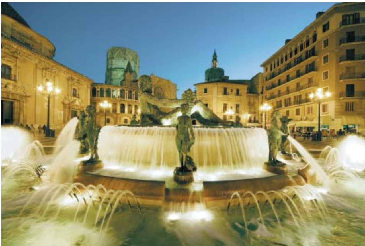
La place de la cathédrale

ce qui permet d'arriver à l'adresse voulue tout en profitant des beaux coups d'œil qui surgissent de-ci, de là.