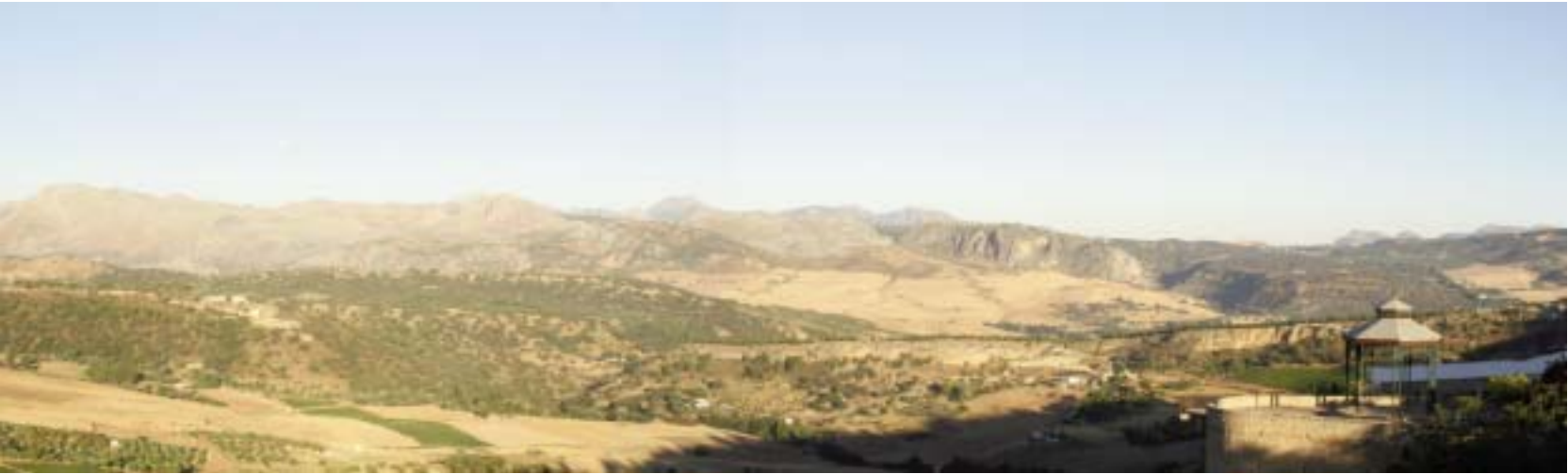
L'extraordinaire panorama que l'on découvre des chambres du Parador Ronda.