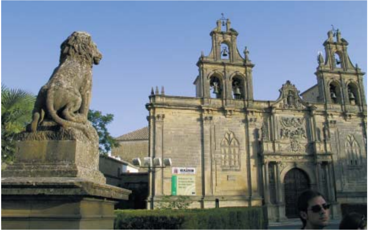
Ubeda. Eglise de Santa Maria de Los Reales Alcazares (XIII-XIXs)

avaient fait fortune en Amérique, aux 16 e et 17 e siècles. On y découvre la statue de Pizarro, parmi d'autres conquistadors qui partirent de Trujillo: « Vingt nations d'Amérique ont été conçues dans le sein de Trujillo », affirme-t-on ici. Encore une ville-musée. Quelles sensations peut-on bien