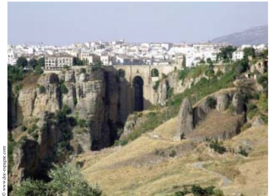
Ronda et son vertigineux Puente Nuevo qui permet de franchir le Tajo.

Pour mieux comprendre le choix de Mérimée lorsqu'il place dans cette région son conte Carmen , -puisqu'il le nomme ainsi-, il faut se transporter en 1830, année où l'inspecteur des monuments historiques de France effectue son premier voyage en Espagne. Il