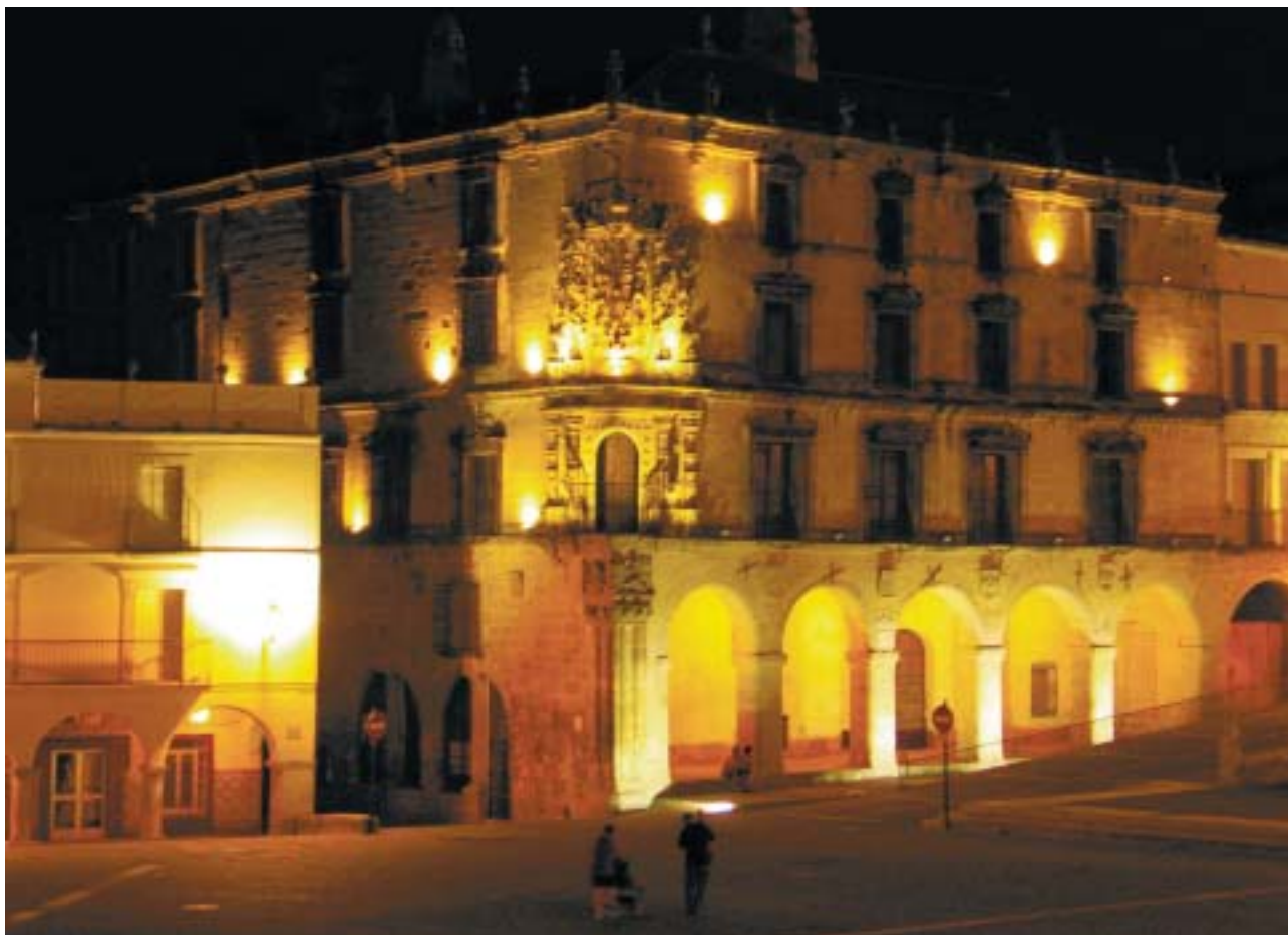
Trujillo. Palais du Marquis de la Conquista élevé par Hernando Pizarro (XVI)

Alcarza. Une étonnante cité Renaissance fière de ses deux clochers voisins de quelques mètres. Ubeda. Eglise San Pablo (XIII-XVIII)