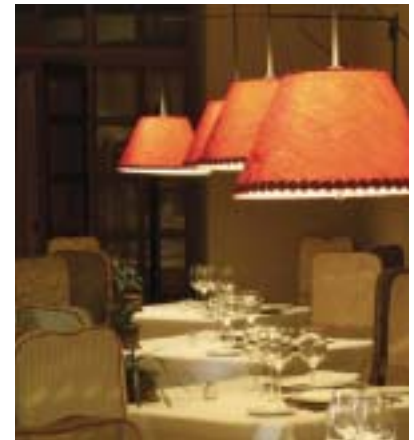
La lumière de l'Andalousie, le blanc éblouissant, le jaune des échelles. Clin d'œil facile. L'ancien puits du château est transformé en fontaine © P. Aimar

Jacqueline Aimar, texte Pierre Aimar, photos