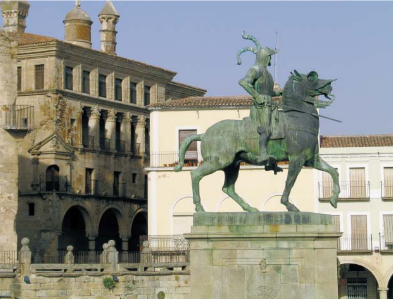
Trujillo. La Plaza Mayor, entièrement piétonne, est, le soir venu, un fantasmagorique théâtre d'ombres et de lumières surveillé par la statue équestre de Pizarro (bronze de C. Rumsey, 1927).