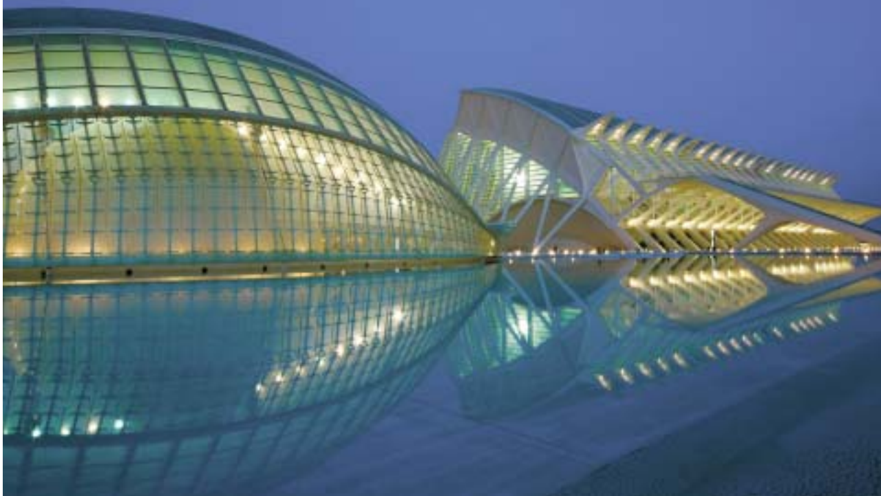
Le Museo de las Ciencias.

La fièvre de la construction s'est emparée de Valencia. Une forte poussée qui provoque des accès d'ego très forts. « Valencia, la ville la plus vivante du monde », « Le vent en poupe, toutes voiles dehors », les slogans volontaristes fleurissent sur les affiches drapeaux, prospectus, dépliants.