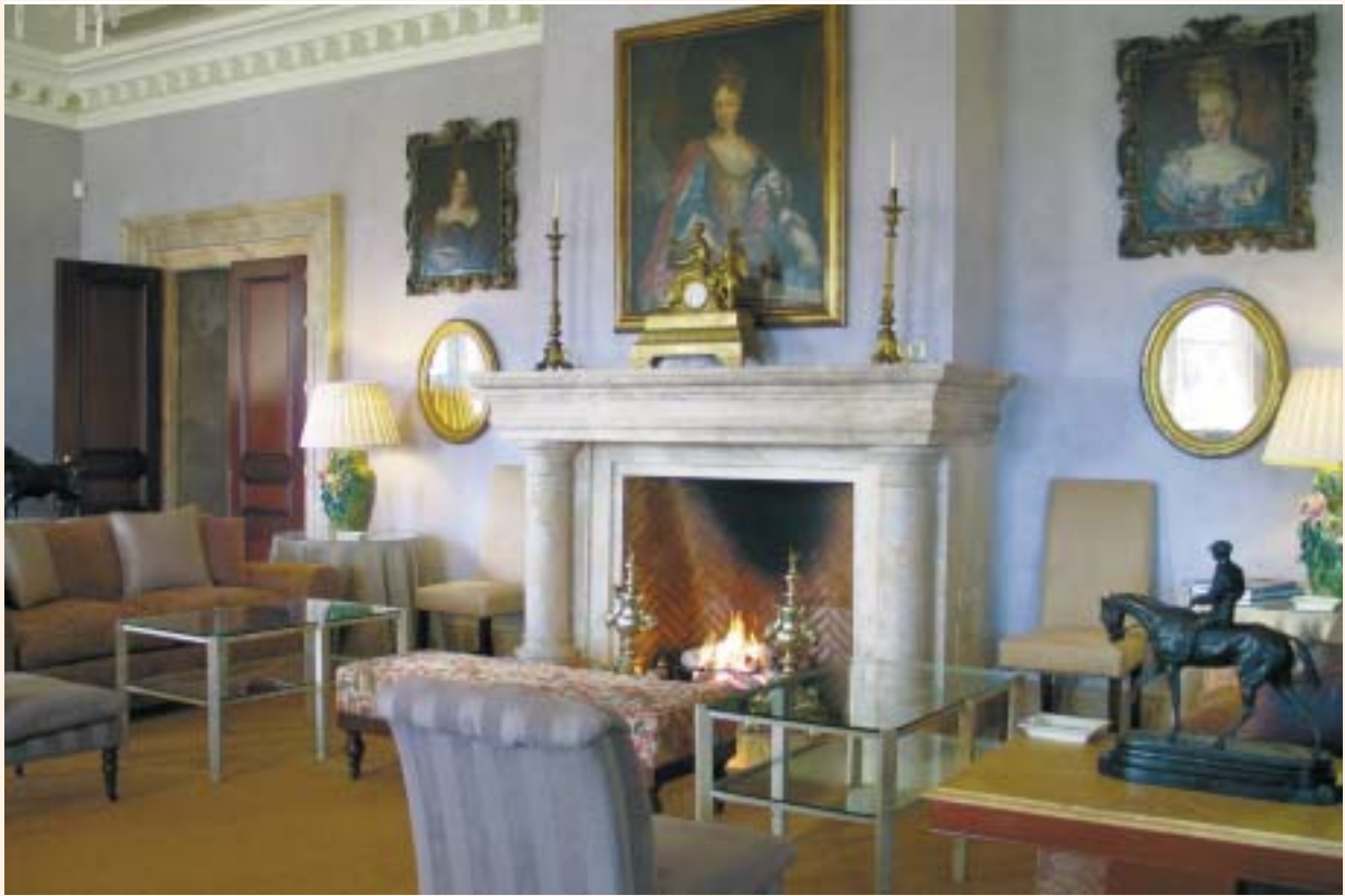
Le charme discret de la bourgeoisie