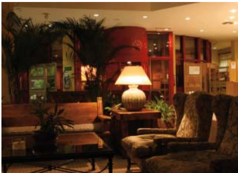
Même de la salle de bains la vue est inoubliable. Les coins salons invitent à la détente.