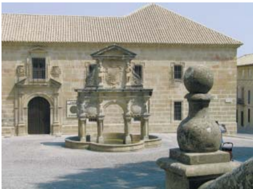
Baeza. Ci-dessus, Plaza Santa Maria, un ensemble architectural où règne la sérénité.