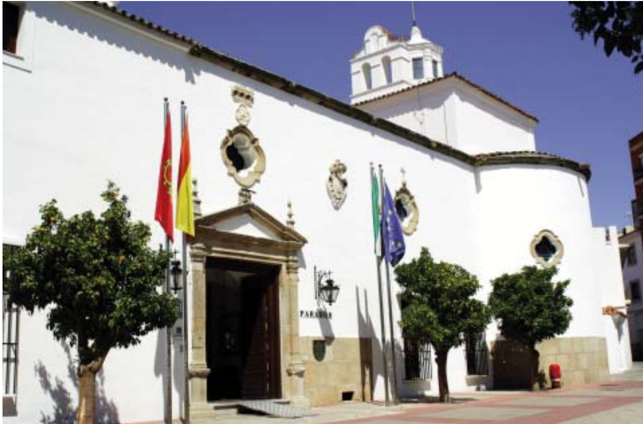
Le Parador de Merida. En bas de page, un patio où se mêlent 2000 ans d'histoire.

Capilla, ou dans le bar sombre et intime. Mais le plus bel endroit est incontestablement le patio à belles voûtes et dont certaines colonnes portent des inscriptions (des tags ?) en arabe témoignant d'un autre passé imprimé sur un passé. Là, toujours, un murmure de fontaine, comme le bruit de la fraîcheur.