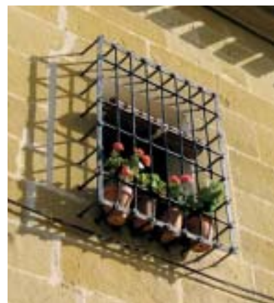
Ubeda. Fenêtre du cloître de Santa Clara

Ci-dessous, Palacio de Jabalquinto à l'étonnante façade gothique.