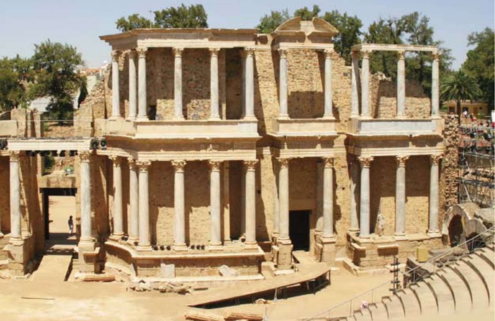
Le théâtre romain de Mérida, un des mieux conservés du monde antique..

des chemins divers vers les marchés de Zafra, Merida, et Caceres. C'est cette route que nous avons empruntée utilisant les Paradores comme châteaux en Espagne, pour le grand plaisir des rêves qu'ils font naître.