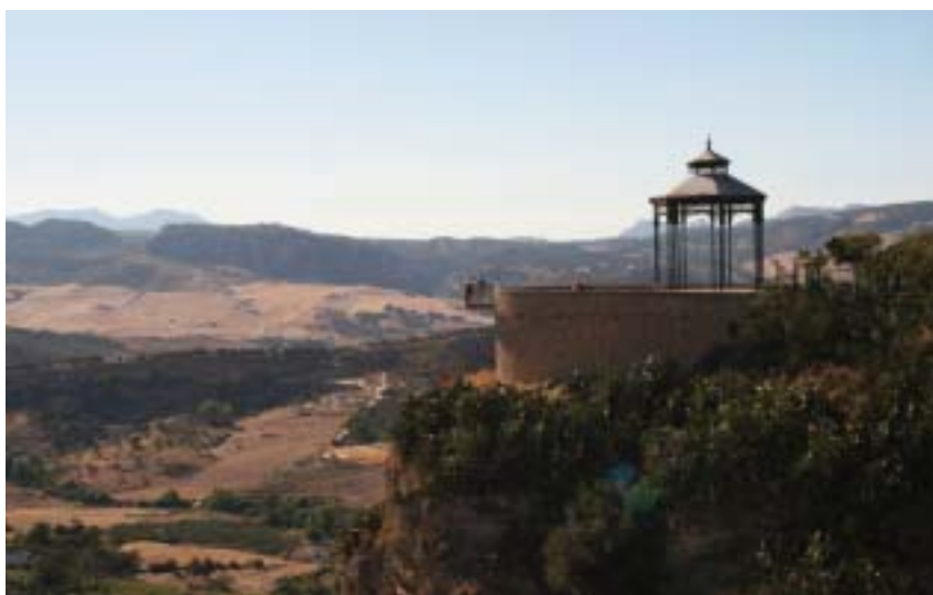
Un kiosque sur l'Alameda Tajo pour mieux dévorer le paysage.