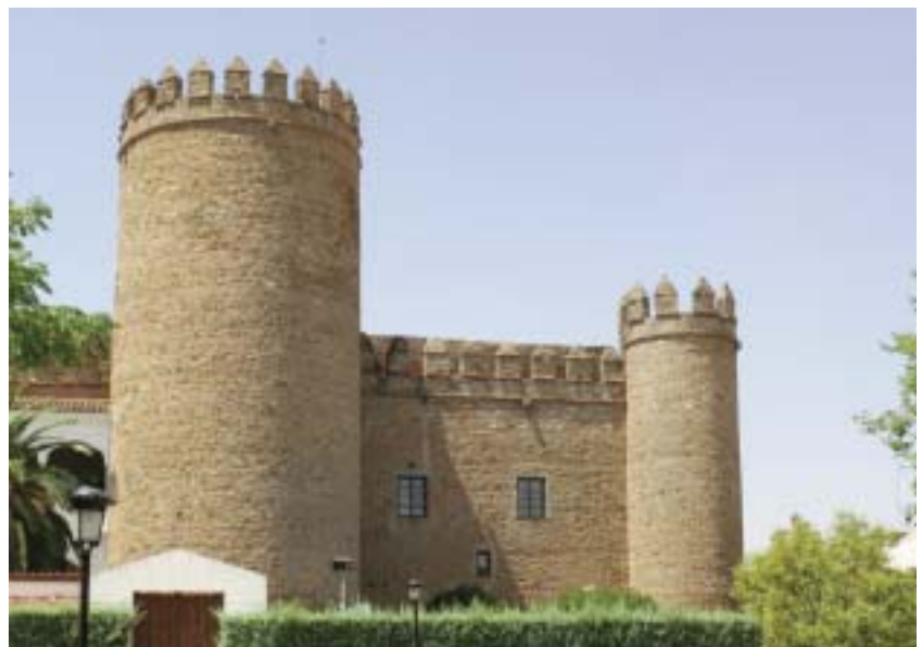
Fortifications du Parador et une façade de la cour intérieur

Partant du patio, aux deux niveaux, de longs couloirs blancs interrompus de petits salons meublés à l'ancienne, proposent une halte fraîche. Un vaste salon très confortable donne sur les monts