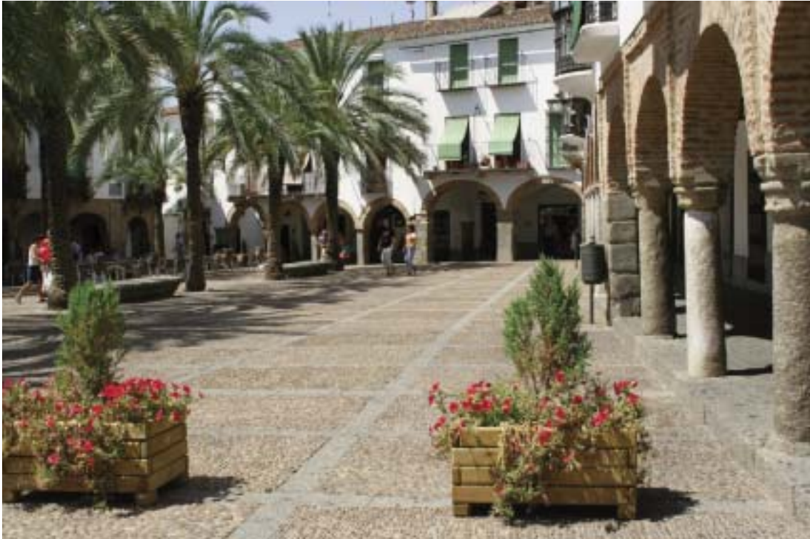
La plaza Grande permet d'accéder à la plaza Cica

murs blancs et briques, fleurissements dans des pots bleus Séville, on trouve en ces lieux toute l'atmosphère andalouse assortie à la lumière qui donne de superbes images de vacances.