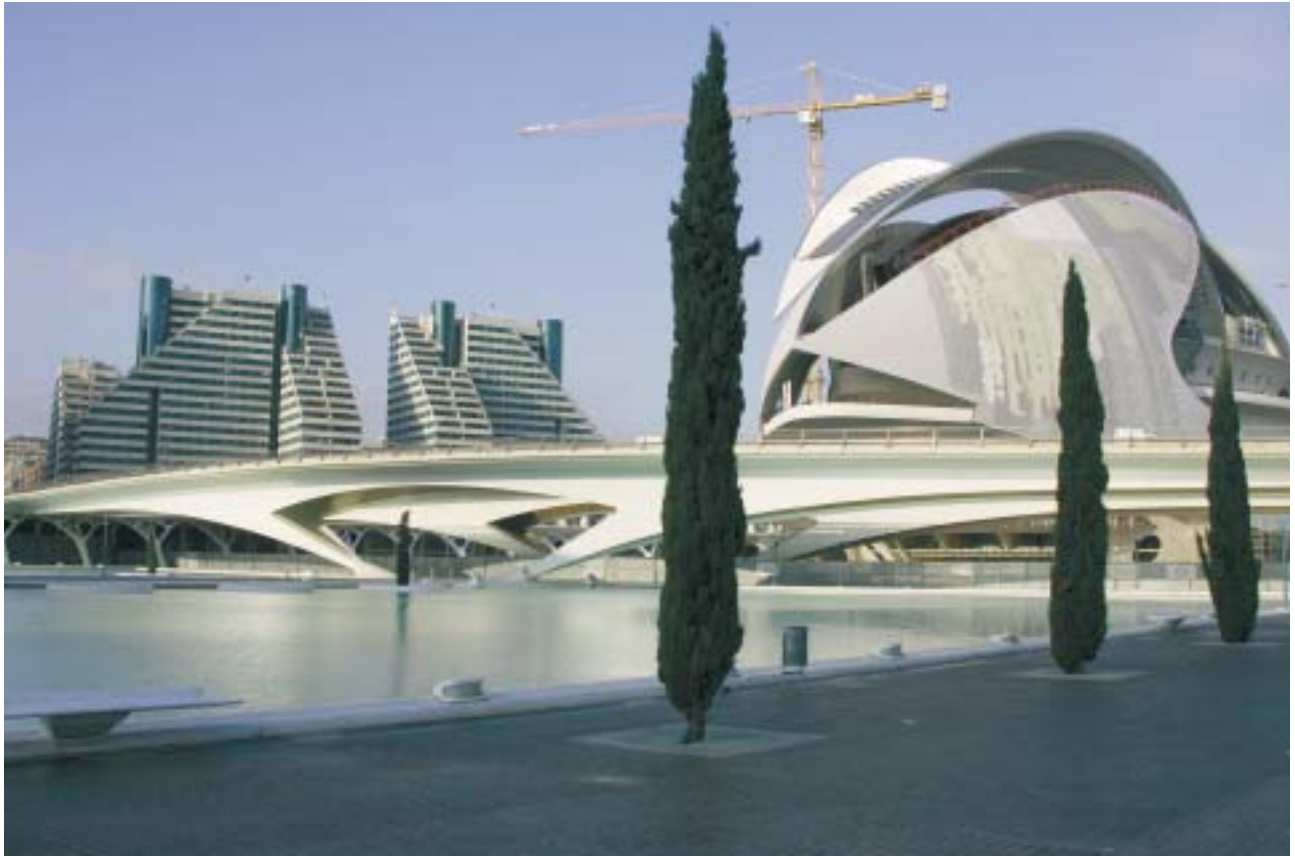
L'opéra et les immeubles contemporains © Alberto Martinez.

La qualité des immeubles de base chez les Ibères modernes est sans comparaison avec les habitations à loyer modéré du pays qui se flatte d'avoir été modelé par le Baron Haussmann. Valencia, en vingt ans, a accompli sa révolution. Elle a bénéficié de l'expérience de ses voisins ultra pyrénéens et de la chance d'être située dans une région plate. La ville a