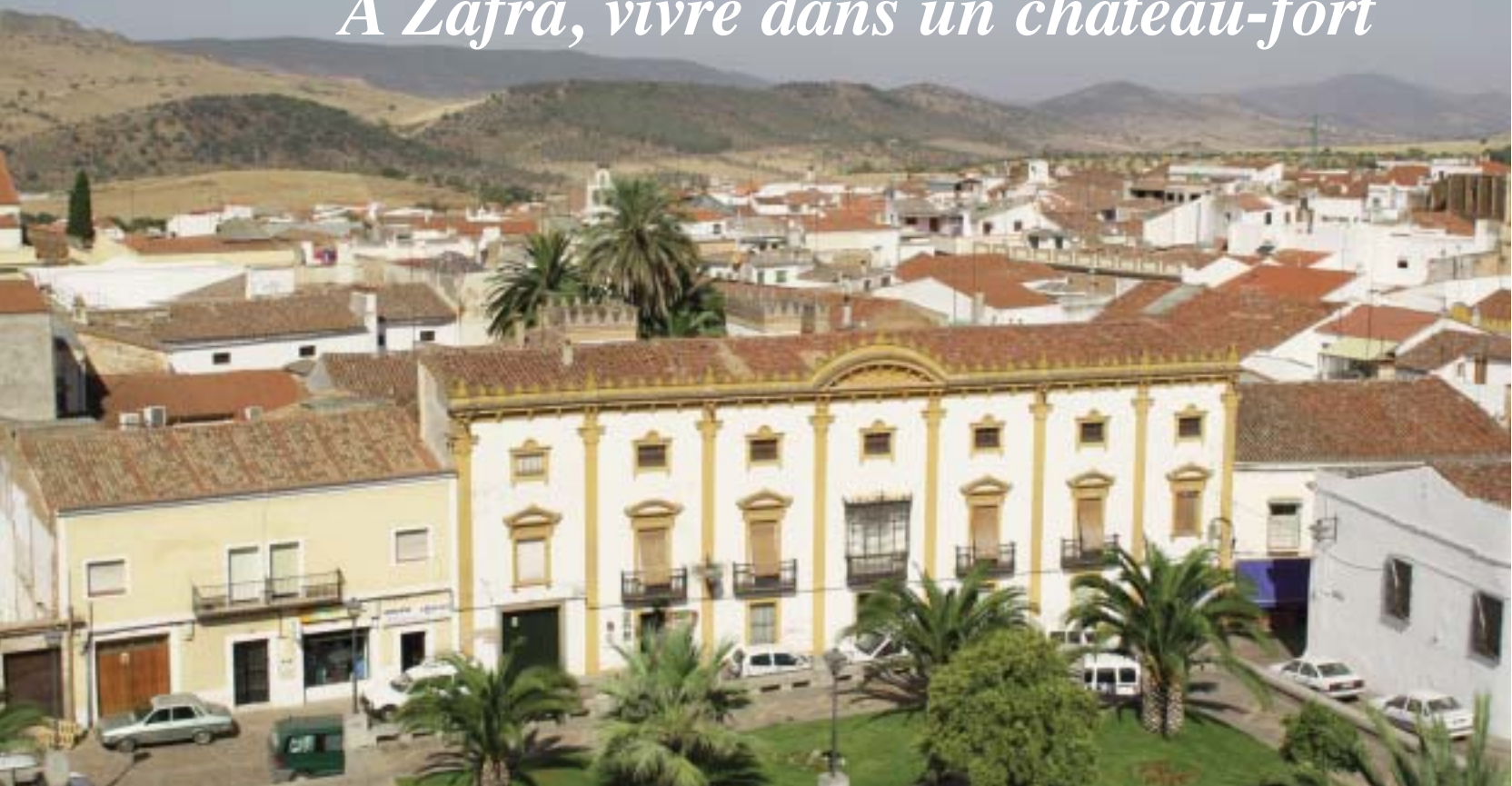
Ville ancienne de Zafra vue des remparts du Parador